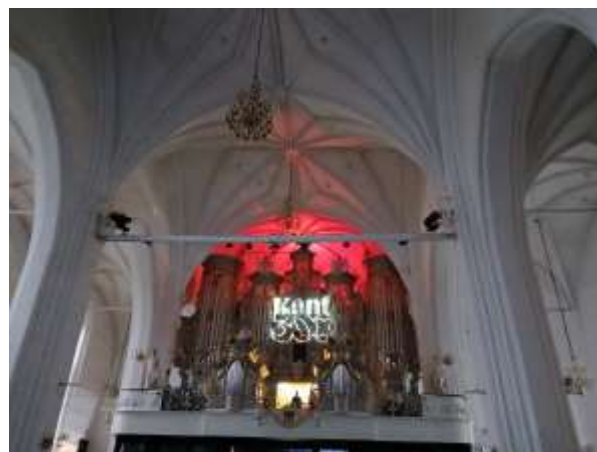
Gedenk-Konzert – Concerto commemorativo