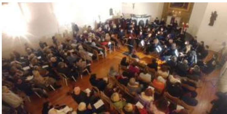
Concerto dell'OpenOrchestra con riprese per la campagna OPM ↑