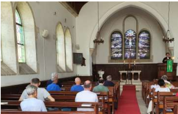
↑ Istantanee dalla nostra Chiesa