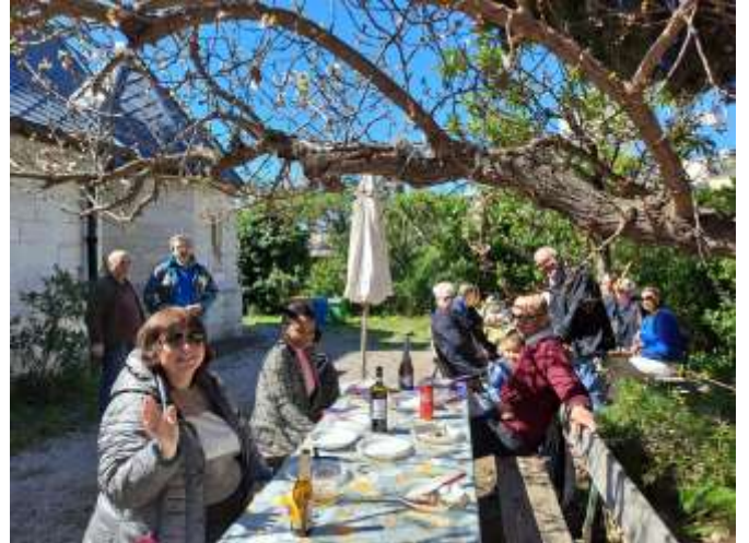
↓ Primavera nel giardino della Chiesa