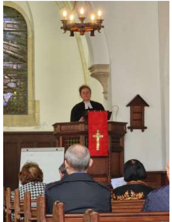
↑ Istantanee dalla nostra Chiesa