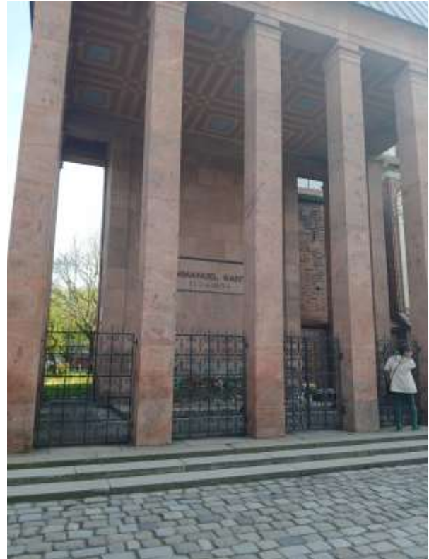
Kant-Grabmal – Tomba di Kant