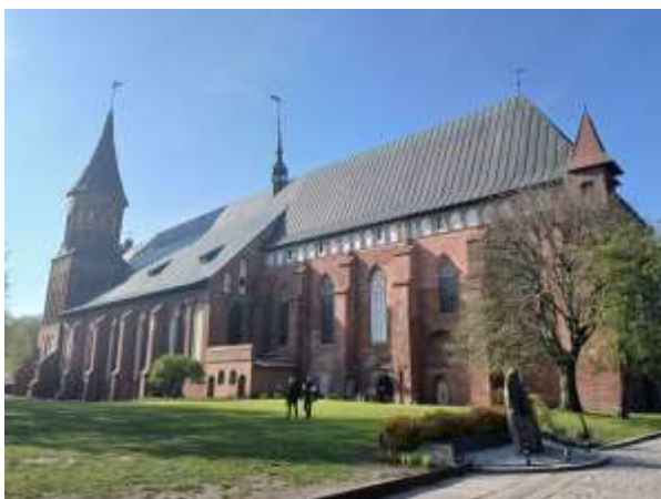
Dom in Kaliningrad – Duomo

Perché conviene commemorare la nascita di Immanuel Kant nel circolare di una comunità della CELI? Può sembrare strano a una persona di origine tedesca oppure svizzera, ma nell'ambito cattolico Immanuel Kant - nato il 22 aprile 1704 nel allora Königsberg (oggi Kaliningrad), nella parte est della Prussia come suddito del re Federico II di Prussia, detto il Grande – viene considerato come il filosofo protestante. Noi protestanti normalmente discutiamo se lui sia stato un cristiano credente ed abbiamo la tendenza di prendere un po' le distanze. Come mai i cattolici possono pensarlo come particolarmente protestante?